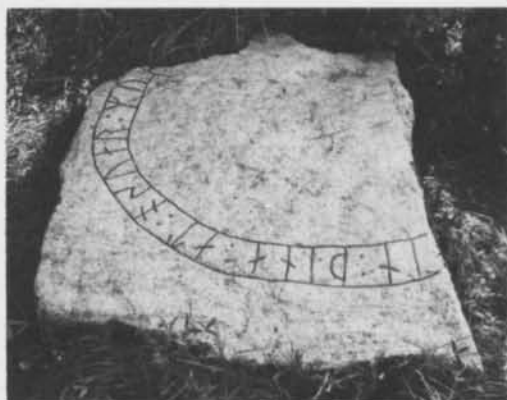
Fig. 3. Runstensfragment från Åkra gård, Bettna sn, Södermanland. — Rune-stone fragment at Åkra, Bettna parish, Södermanland.

Före 1 i finns inga spår av runor i brottkanten. 1 i är grund och utvittrad men säker. Bistaven i 2 n är skrovlig och utvittrad; den går i en naturlig fåra i stenytan. 3 þ är grund och bistaven del-