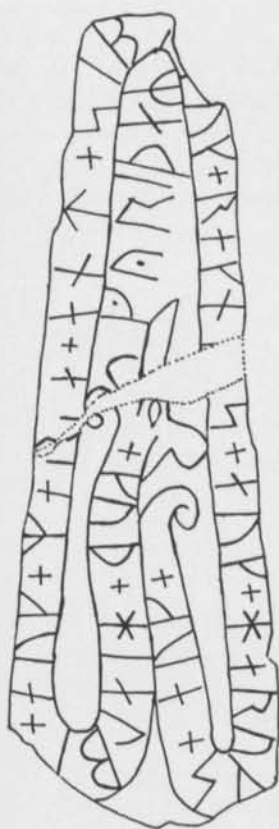
Fig. 5. Runstenen U 558 Prästgården, Husby-Lyhundra sn, Uppland, jämte författarens renritning av inskriften. — Rune-stone U 558 Prästgården, Husby-Lyhundra parish, Uppland.

känt från två runinskrifter och det därtill på två runstenar i närheten av varandra är det väl ganska säkert, att de två namnbeläggen avser samma person.