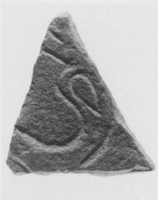
Fig. 4. Ornerat sandstensfragment från kv. Silen, Södertälje. Foto B. Lundberg 1984 (ATA). — Ornamented fragment of sandstone from the Silen quarter, Södertälje.

I samband med en provundersökning av en boplatzlämning i kvarteret Silen i Södertälje, dvs. vid Stockholmsvägen alldeles invid Södertälje kanal, påträffade Kjell Nordeman den 3 juli 1982 ett ornerat, 15 × 10 cm stort och 3,5 cm tjockt fragment av röd finkornig sandsten. Fig. 4. Fyndet gjordes i ett lager 5,5 m över havet och har av Nordeman daterats till 1000-talets slut eller till omkring 1100. Den fortsatta undersökningen visade, att kulturlagren utgjorde resterna av det tidigmedeltida Södertälje (K. Nordeman). På ristningsytan finns rester av ornamentik i form av ett ofullständigt rundjurshuvud. Ornamentiken talar för att fragmentet