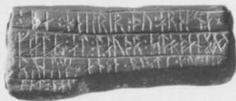
Fig. 6. Bryne med runinskrift funnet i Sigtuna. — Whetstone with runes from Sigtuna, Uppland.

seer, ett litet skifferbryne till Runverket för undersökning.